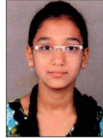
Vara-Riya B.Com.- 5 (Eng.)